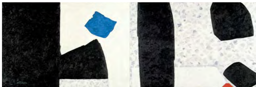
村井正誠《大覚寺》1992年