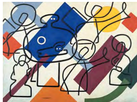
村井正誠《聖母と天使達》制作年不詳