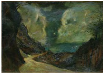
小堀四郎《一つ星》1955年