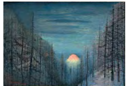
小堀四郎《冬枯れの美》1986年