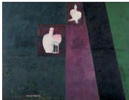
村井正誠《不詳(パンチュール)》1929年