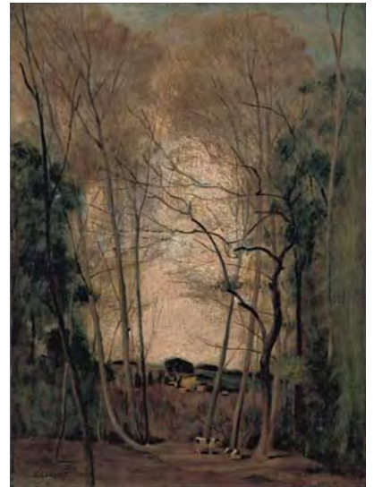
小堀四郎《鶴川風景》1944年